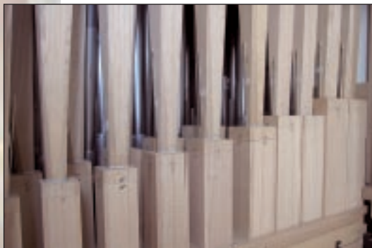
Et kig ind til Basun 16' i det ene pedaltårn. Basunen er som mange andre piber i orglet fremstillet af det fineste egetræ.