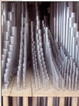
Et lille udsnit af nogle af orglets i alt 3054 piber.

Der måtte en fintælling af piberne til, før orgelbyggeren kunne fastslå det præcise antal.