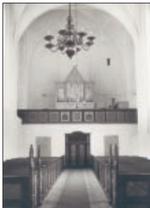
Mariager kirkes første kendte orgel, som i dag står og gør god fyldest i Dråby kirke.

Det er heller ikke hvert årti eller århundrede, der kommer et