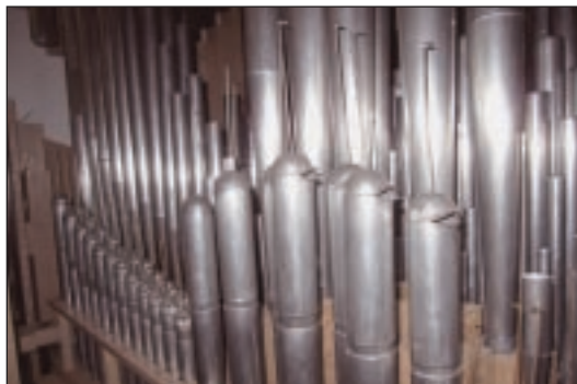
Voix humana 8' som sidder som eneste 8 fods rørstemme i recit. Den har en karakteristisk udformning næsten som et fuglenæb.